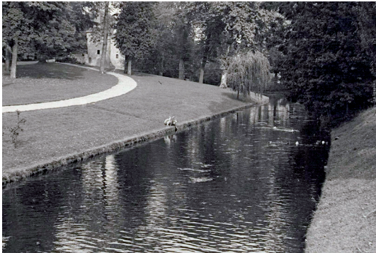
Westbuitensingel rond 1950